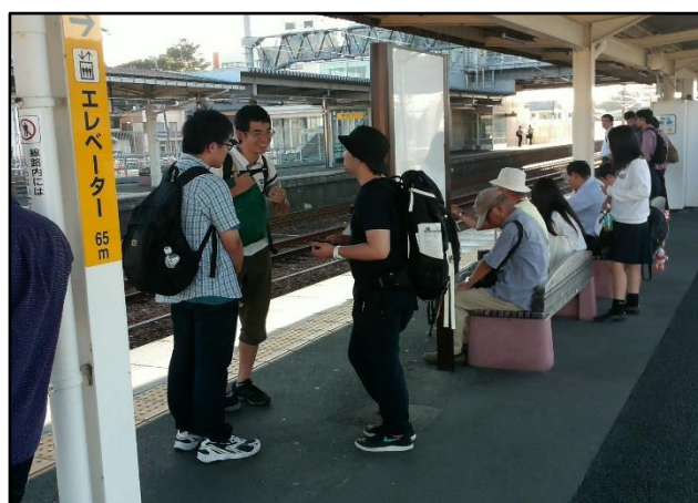
写真 6. 解散前の高塚駅にて