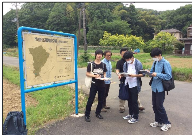
写真 2. チェックポイントで指摘を受ける学生たち