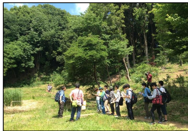
写真 4. 丘陵地の地形と植生の関係を学ぶ