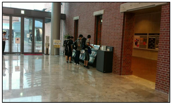
写真2. トヨタ産業技術記念館にて

2日目は，栄駅から地下鉄を乗り継いで赤池駅へ，そこから徒歩でレトロでんしゃ館へと向かいました（写真3）。レトロでんしゃ館では，名古屋市交通局の歴史を知ることができました。その後，同館に隣接する名古屋市営地下鉄日進工場において，元現場職の方から工場について説明をして頂きました（写真4）。ここでは，鉄道の仕組みやメンテナンスの頻度等について理解を深めることができました。近年はモーターなどの