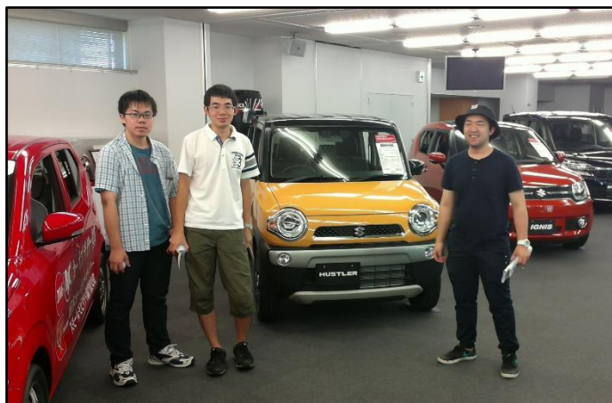
写真 5. スズキ歴史館にて

名古屋市営地下鉄日進工場を後にし、赤池駅にて各自昼食を済ませました。その後、名鉄豊田線、三河線、名古屋本線、東海道本線と乗り継ぎ、浜松駅の隣駅である高塚駅まで移動しました。そこから徒歩でスズキ歴史館へ向かいました。スズキ歴史館は、スズキ自動車の工場に隣接する形で立地しており、近隣の住宅や駐車場の車やバイクは、スズキの車種が多かったようにみえました。創業当初は、スズキ自動車もまたトヨタと同じように織機メーカーであったのですが、のちに二輪自動車・四輪自動車等の生産を行うようになりました（同館パンフレットより）。当初は、自転車にエンジンを載せた原動付自転車を生産・販売をしていましたが、のちに一般的な形のバイクを生産・販売するようになり、その後に軽自動車をはじめとする四輪車の生産も行われるようになりました。展示されていた当時の軽自動車は、現在の規格より小さく、いかに現在の軽自動車や普通車が、安全性や居住性等の各面から大型化したのかが分かりました。スズキ歴史館にもトヨタ産業技術記念館と同様、海外からの見学者もたくさんいました。このことは、最近に訪日観光客が増加しているということばかりではなく、スズキ自動車の主な販売先であるインドなどからの訪問者が多いことによるのかもしれないと考えました。その後、東海道本線に乗り、浜松駅にて解散となりました。