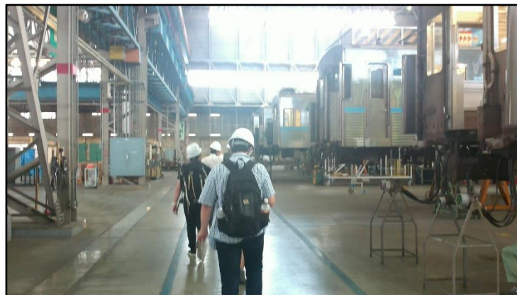
写真 4. 名古屋市営地下鉄日進工場にて

名古屋市営地下鉄日進工場を後にし、赤池駅にて各自昼食を済ませました。その後、名鉄豊田線、三河線、名古屋本線、東海道本線と乗り継ぎ、浜松駅の隣駅である高塚駅まで移動しました。そこから徒歩でスズキ歴史館へ向かいました。スズキ歴史館は、スズキ自動車の工場に隣接する形で立地しており、近隣の住宅や駐車場の車やバイクは、スズキの車種が多かったようにみえました。創業当初は、スズキ自動車もまたトヨタと同じように織機メーカーであったのですが、のちに二輪自動車・四輪自動車等の生産を行うようになりました（同館パンフレットより）。当初は、自転車にエンジンを載せた原動付自転車を生産・販売をしていましたが、のちに一般的な形のバイクを生産・販売するようになり、その後に軽自動車をはじめとする四輪車の生産も行われるようになりました。展示されていた当時の軽自動車は、現在の規格より小さく、いかに現在の軽自動車や普通車が、安全性や居住性等の各面から大型化したのかが分かりました。スズキ歴史館にもトヨタ産業技術記念館と同様、海外からの見学者もたくさんいました。このことは、最近に訪日観光客が増加しているということばかりではなく、スズキ自動車の主な販売先であるインドなどからの訪問者が多いことによるのかもしれないと考えました。その後、東海道本線に乗り、浜松駅にて解散となりました。