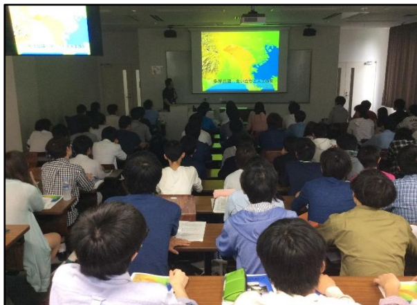
写真 1. 長谷川先生の関東地方の地形解説からスタート

課題 : 図表を含めて 400 字詰め原稿 10 枚以上相当のレポート. 提出日時 ...7 月 12 日 (火) 5 限「地域調査法」の授業時