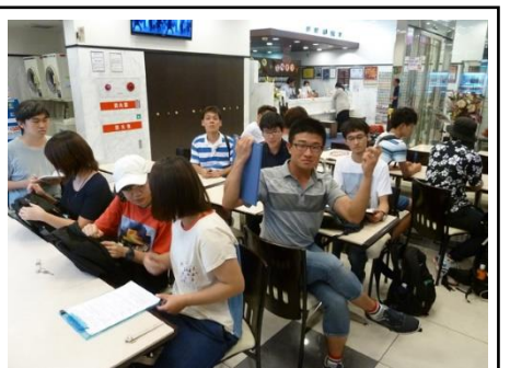
内田ゼミ：ホテルのロビーでブリーフィング

実施地：沖縄県那覇市およびその周辺地域 参加学生数：12名（男子9名，女子3名） テーマ：学生各自でテーマを設定し，現地調査を行う。 内容：首里城公園における観光客の行動パターン，沖縄海洋博公園における観光客の行動特性，座間味村における民宿地域の形成と現状，沖縄県における華僑・華人の生活空間，地域インフラの発達・整備による着地型観光の発展—沖縄県ハンタ道を事例に一，太平洋戦争沖縄戦についての認知度—沖縄県観光客を対象に一，那覇市におけるアパレル小売店の立地とアメリカンカジュアルの関係，など