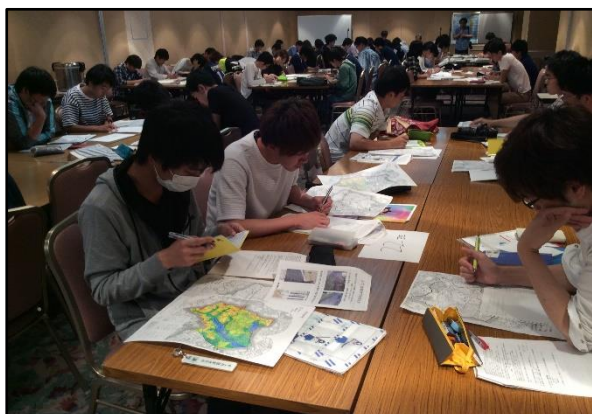
写真 5. 1 日目の夜 : ミーティングで調査内容をまとめる