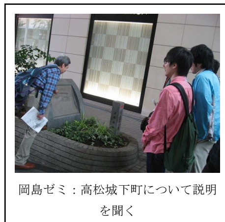
岡島ゼミ：高松城下町について説明を聞く