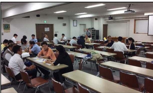
写真3. 災害・防災・被災地教育のあり方を議論する参加者の皆さん