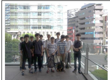
加藤班：集合写真 （品川インターシティ前）

実施地：東京都品川区 参加学生数：11名（男子11名，女子0名） テーマ：品川区における「工場跡地」の利用—品川の地誌、とくに産業構造転換と地域変化について— 内容：品川区内に約20年前（1995年初）に立地していた工場（50人以上）の「その後」を調べる。現存する工場とその特徴（業種・立地の特徴など）、跡地利用の状況（転換状況・土地所有など）やその特徴（業種・立地の特徴など）を調査し、都市の土地利用変化について考察する。それを通じて、経済地理学的な見方・考え方・調査法の基礎を学ぶ。 課題：調査結果に関する図を作成し、調査結果にもとづいた内容についてレポートする。