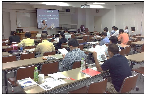
写真2. 小関先生の講義の様子