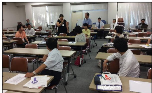
写真4. 発表会の様子 内容の濃い発表が相次ぎました。