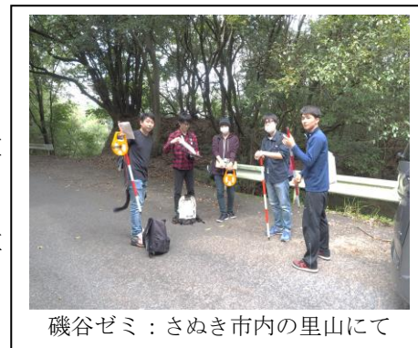
磯谷ゼミ：さぬき市内の里山にて