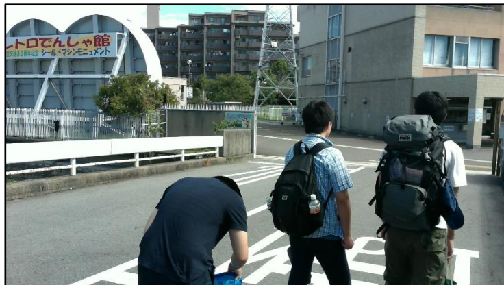
写真 3. レトロでんしゃ館に到着

部品のオーバーホールを他の会社に委託しているとのことでした。その理由は、委託することにより費用が削減できるからとのことでした。