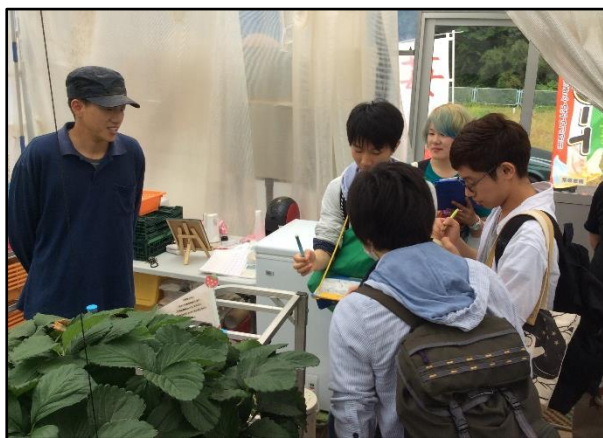
写真 3. 農業生産者にヒアリングをする学生たち